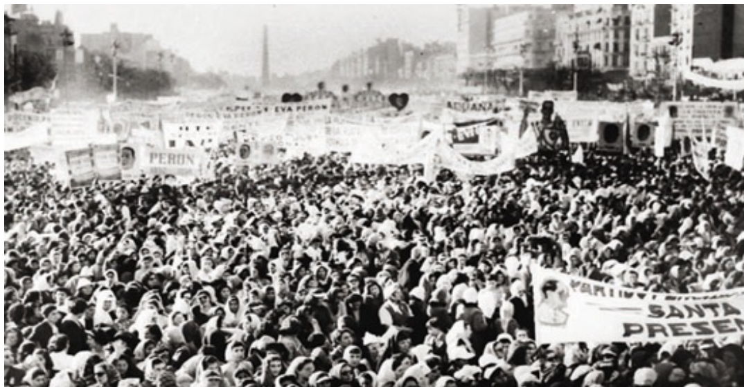
Las masas, el cine y la televisión

diCom › Novedades › (Historia de los medios)