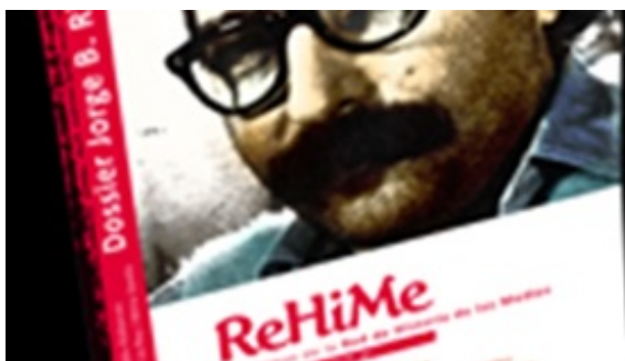
Cuadernos de la Red de Historia de los Medios – Nr 1

“...la historia permite comprender algunas facetas del presente porque en ella entran en tensión diferentes relatos. La definición misma de los medios se vuelve imprecisa en el momento de hacer su historia.”