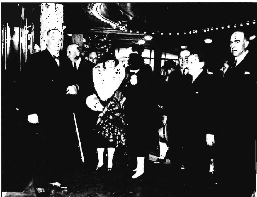
El presidente Alvear y su esposa Regina Pacini (izquierda) con Max Glücksmann (segundo a la derecha) en la inauguración de su nuevo salón, septiembre de 1927.