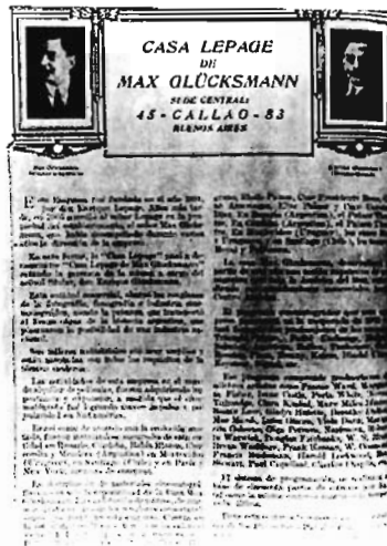
Gacetilla de prensa, sin fecha, de Max Glücksmann.

Uno se pregunta quiénes eran esas personas pobres o huérfanas para las que la clase dirigente reservaba un lugar de reclusión y a quiénes estaban dirigidas estas intranquilizadoras y persuasivas imágenes. El filme no sugiere la razón de esta pobreza, más bien refiere una situación de hecho en la que se destaca la obra casi misionera de estas damas. Estas cintas no están dirigidas solamente al gran público de los cines comerciales sino especialmente a las instituciones de beneficencia y a sus damas pues su obra, a partir de las necesidades que se muestran, queda totalmente justificada. 18