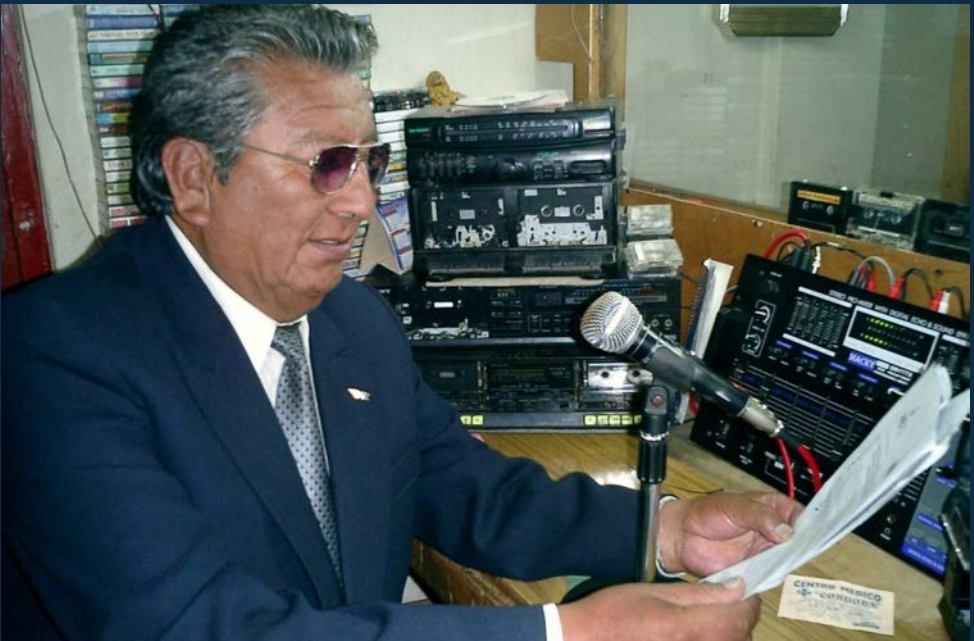
Arriba: Emisora Onda Azul. Abajo: Radio La Voz del Altiplano.