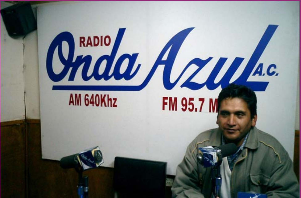
Arriba: Radio Pachamama. Abajo: Radio Onda Azul.